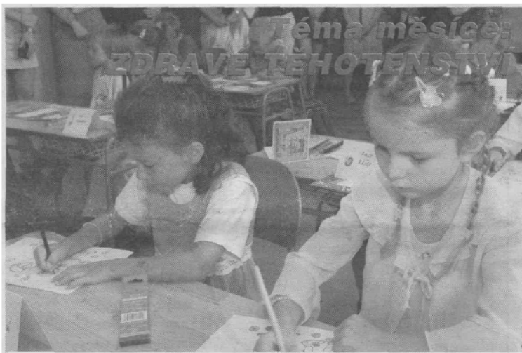
Prvníáci se většinou do školy těší, cítí se být starší, váženější. Čas, kdy si jen hráli, už jim ale končí...

Vrátím-li se k mladíkovi na křižovatce: proč vůbec potřebujeme rychle mačkat přepínač, proč musíme být o půl minuty rychleji na druhé straně? Co pro nás může „druhá strana“ znamenat? Přijít někam o tu chvilinku dříve? O půlminutku rychleji mft koupený rohlík? Nevydržet stát 30 vteřin na chodníku a pozorovat lidi kolem? Kam tak spěcháme, pádíme, běžíme? Jednou ráno se takový dnes dvacetiletý mladík vzbudí, bude mu přes padesát a bude se divit, kdy se to vlastně stalo... Važme si každé vteřinky našeho života, právě nyní jiný